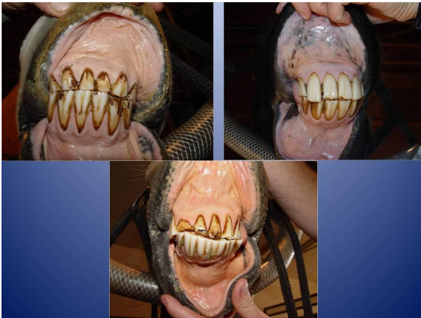
Lõikehammaste valehambumused-saab kontrollida ka hobuse omanik!