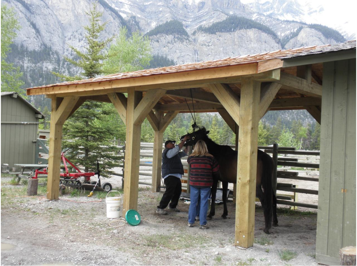
Hammaste kontroll ja viilimine on lihtsad protseduurid, mida on võimalik läbi viia peaaegu igalpool