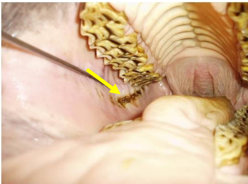
Teravad ülemised purihambad on katki teinud põse limaskesta ja tekitanud sügavad armid (nool)